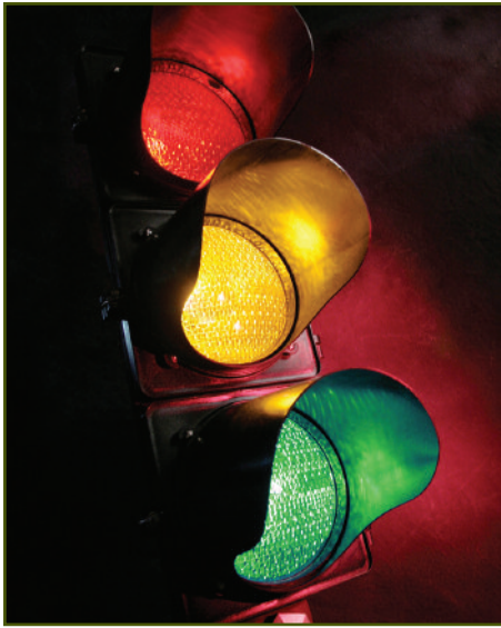
Obedecer los semáforos ayuda a mantener el orden y la seguridad.